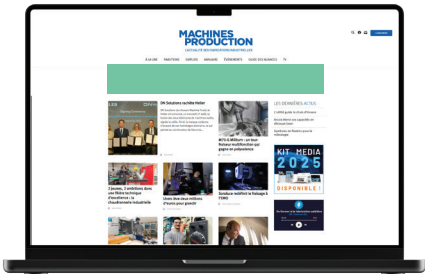
Horizontales Banner (1150 × 150 Pixel)